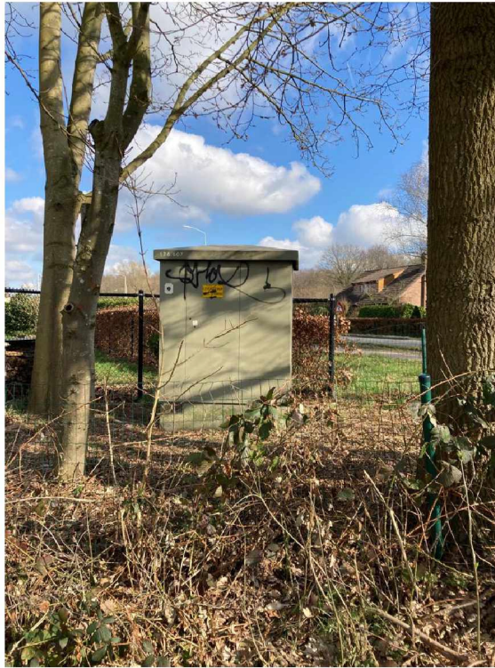
Voetgangerspad langs de bergsebaan