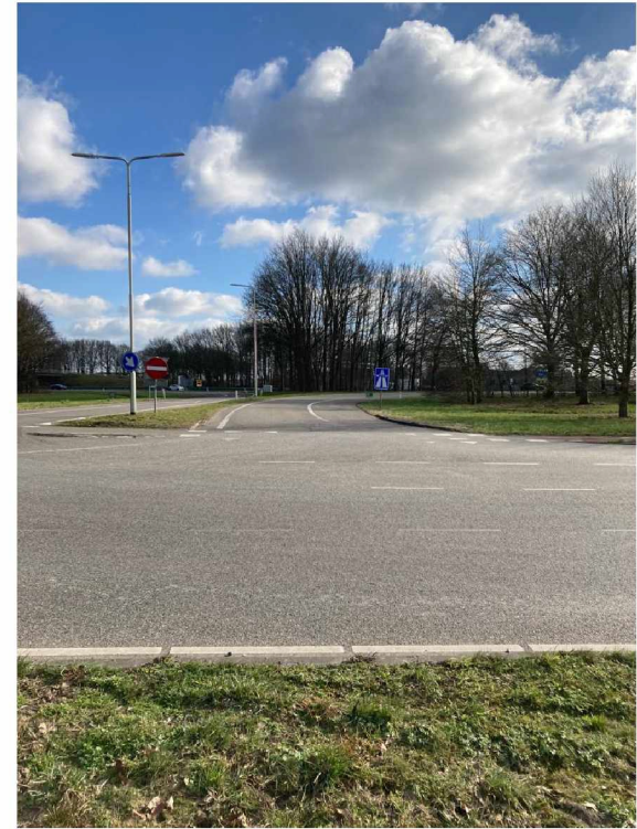
Kleine bedrijven ten westen van P1144