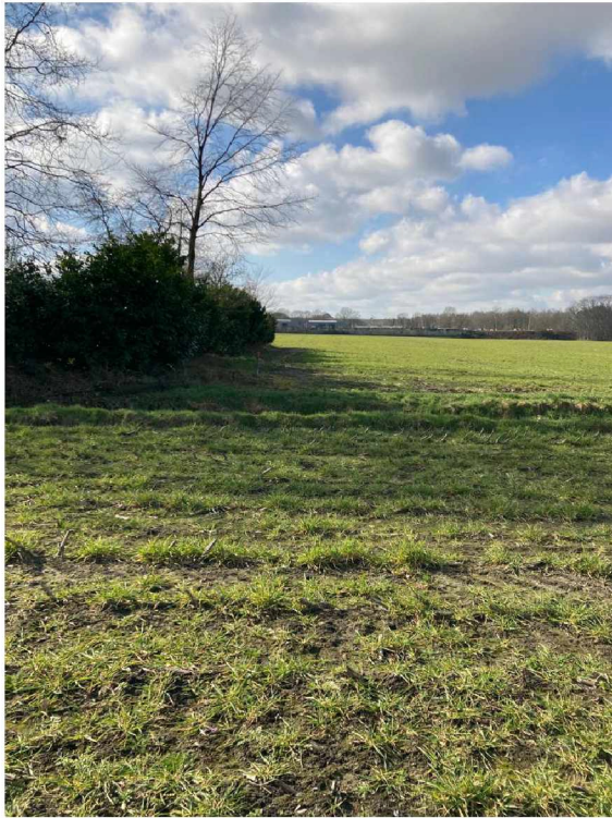
Verdeler kast P723