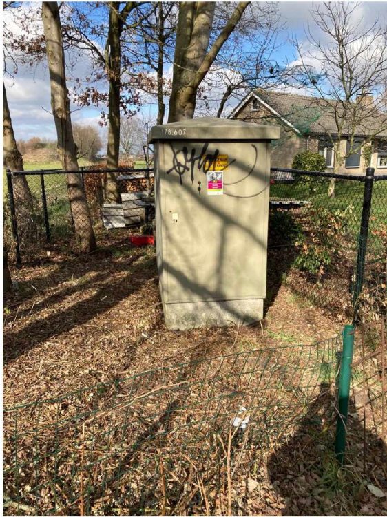
Greppel langs het terrein