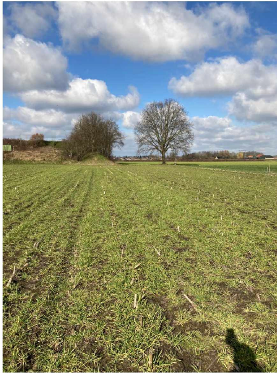
Verdeler kast P723